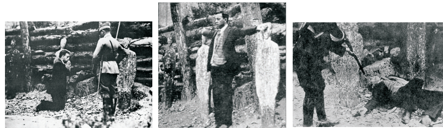
Fotografije sa strijeljanja isusovca, bl. Mihovila Augustina Pro, koji je bez suda ubijen u Meksiku 1927. g. Zadnje su mu riječi bile: Živio Krist Kralj!

Kršćani su praktično bili 'divljač za odstrijel'. Meksički ustav od 1917. potpuno je obespravio oko 90% katolika. Nakon stanovitog vremena pasivnog otpora, izbio je u narodu ustanak "kristerosa" koji se nisu mirili s tom obespravljenošću i sa iskorjenjivanjem vjere. Borili su se s usklikom "Živio Krist Kralj!". Mnoštvo nevinih ljudi, katolika, ubijeno je bez ikakva suda. I mirali